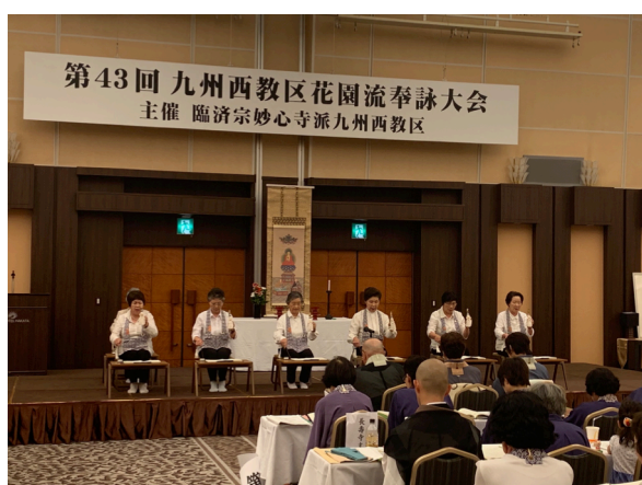
奉詠する徳門寺支部の皆さん