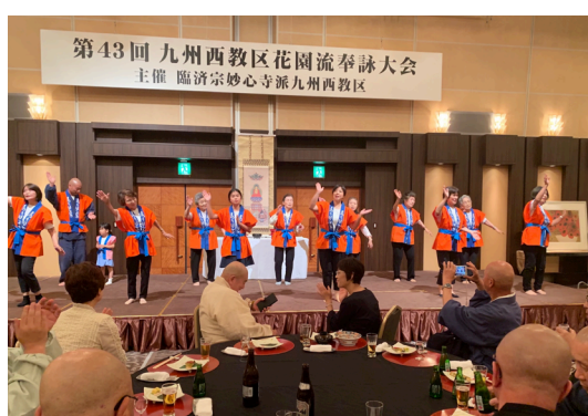
各支部毎年趣向を凝らした出し物で 大変盛り上がります。

仏教や禅の深く尊い教えが、誰 にもわかる親しみやすい言葉で 表されていますので、お唱えする うちに仏さまの教えに自然に 親しむことが出来ます。 興味のある方は是非 お寺までお申し出下さい。