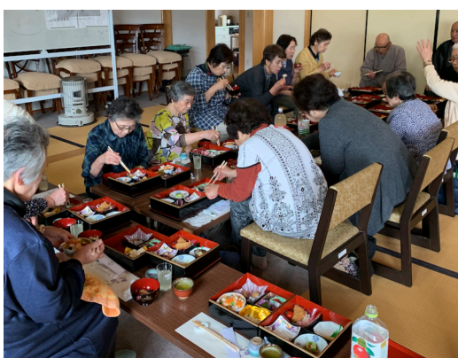
法要後は和気藹々とした楽しい 時間を過ごさせていただきました。