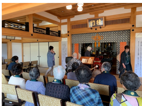
皆さんでご供養いたしました。